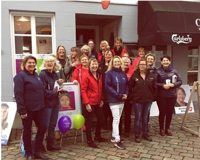
Gang i gaden i Syddjurs kommune, kvindelige kandidater på vej til at fiske stemmer.

Kvinderne var bl.a. ude på torve, biblioteker og gågader for at snakke med vælgerne, dele vores materiale ud og vise at der naturligvis – uanset hvilket parti man stemmer på – er kvalificerede kvinder at finde på listerne.