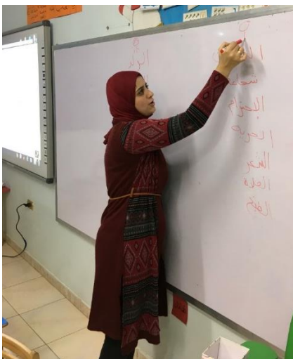
En af de undervisere som er blevet trænet i seksualundervisning af unge i projektet Sexual Education among Youth in Egypt