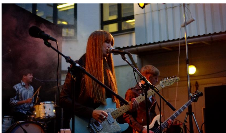
Talk Town by night.

Mød op med et fordomsfrit sind, og jeg vil garantere dig, at du går fra Talk Town med ny viden og nye bekendtskaber".