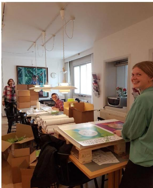
Så pakkes der valgmateriale i sekretariatet.

"Ih, hvor godt i ringer, vi har ventet på det", sådan eller næsten sådan lød det flere gange, da vi efter at have mailet invitationer ud til hundredvis af de kvinder, der stillede op ved novembermåneds kommunalvalg, ringede rundt for at finde lokale tovholdere til vores kampagne "Stem flere kvinder ind". Kampagnen løb af stablen i weekenden 3.-5. november.