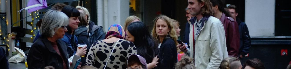
Talk Town – også i Hovedbibliotekets baggård.