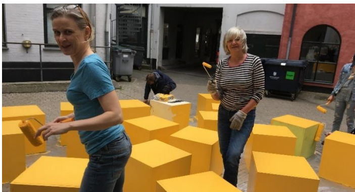
Talk Town forberedes, sekretariatet i gang med malerrullerne.

Skal psykisk vold kriminaliseres?; Ikke-binære stemmer; Hvor skal faderskabet stå?; Tag nettet tilbage; Køn og det offentlige rum; Feminisme i Nordafrika; Lær at kode; Socialpolitikken er ikke køn; Køn og kommunalvalg; Fleksibel arbejdstid og; Flygtningekrisen er ikke kønsneutral er et meget lille udpluk af overskrifter på debatter, talks og events som organisationer, enkeltpersoner, netværk, partier og alle mulige andre havde valgt at sætte på plakaten til Talk Town festival i maj.